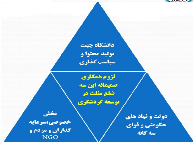
شکل (۱-۲): ذینفعان گردشگری و مثلث توسعه گردشگری (منبع، مجری طرح).